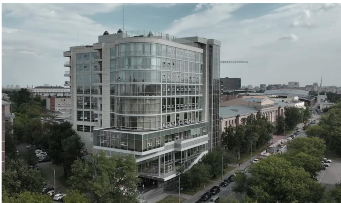
ВГИК, ул. В. Пика, 3