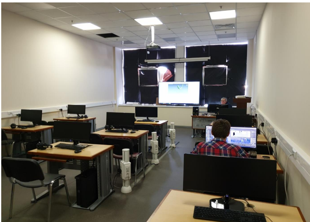
Компьютерный класс факультета анимации и мультимедиа

На факультете анимации и мультимедиа функционирует компьютерный класс, оснащённый современным оборудованием. В классе проводятся занятия со студентами по обучению работы в 3D, 3D-анимации, созданию спецэффектов и монтажу.