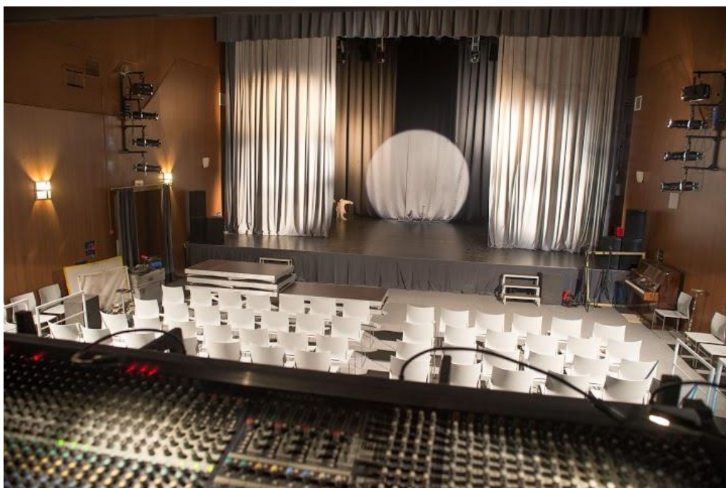
Учебный театр ВГИКа

На художественном факультете занятия по специальным дисциплинам, мастерству художника фильма, проводятся в творческих мастерских, расположенных и оборудованных с учетом специфики – рисунок и живопись. На факультете существуют обширный методический фонд, насчитывающий более 10000 работ, большой реквизитный фонд, который используется как для обучения студентов, так и для съемочного процесса.